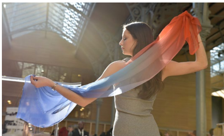
Made in France Première Vision

L'artiste Marie-Ange Guilleminot profitait de l'invitation du salon pour expérimenter de nouveaux dialogues avec les acteurs de la filière française et les multiples possibilités techniques que peut offrir celle-ci pour tendre vers la constitution d'une Garde-robe "standard et sur-mesure". L'esprit de cette collaboration artistique était de constituer une Garde-robe dont chaque vêtement et chaque accessoire rendait hommage à un auteur de la littérature française.