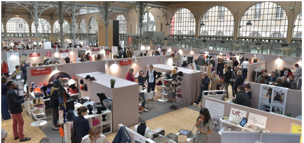
© Nicolas Rodet - Made in France Première Vision

Capables de répondre aux besoins de marques et créateurs exigeants grâce notamment à une expertise technique, à un potentiel créatif fort et à des capacités de production fiables, les sociétés exposantes à MADE IN FRANCE PREMIÈRE VISION sont de véritables partenaires de l'excellence qui soulignent volontiers le rôle essentiel de MADE IN FRANCE PREMIÈRE VISION pour le développement et la communication de leur activité.