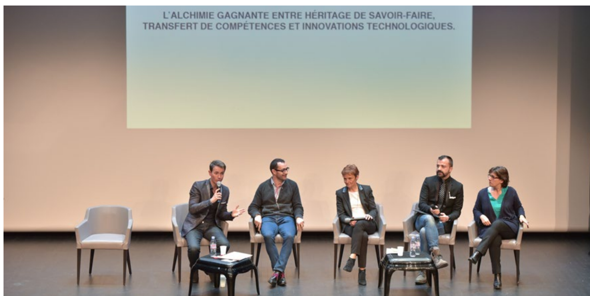
© Nicolas Rodet - Made in France Première Vision

Une conférence qui, au vu et aux dires des 200 professionnels du secteur venus y assister, a connu un franc succès.